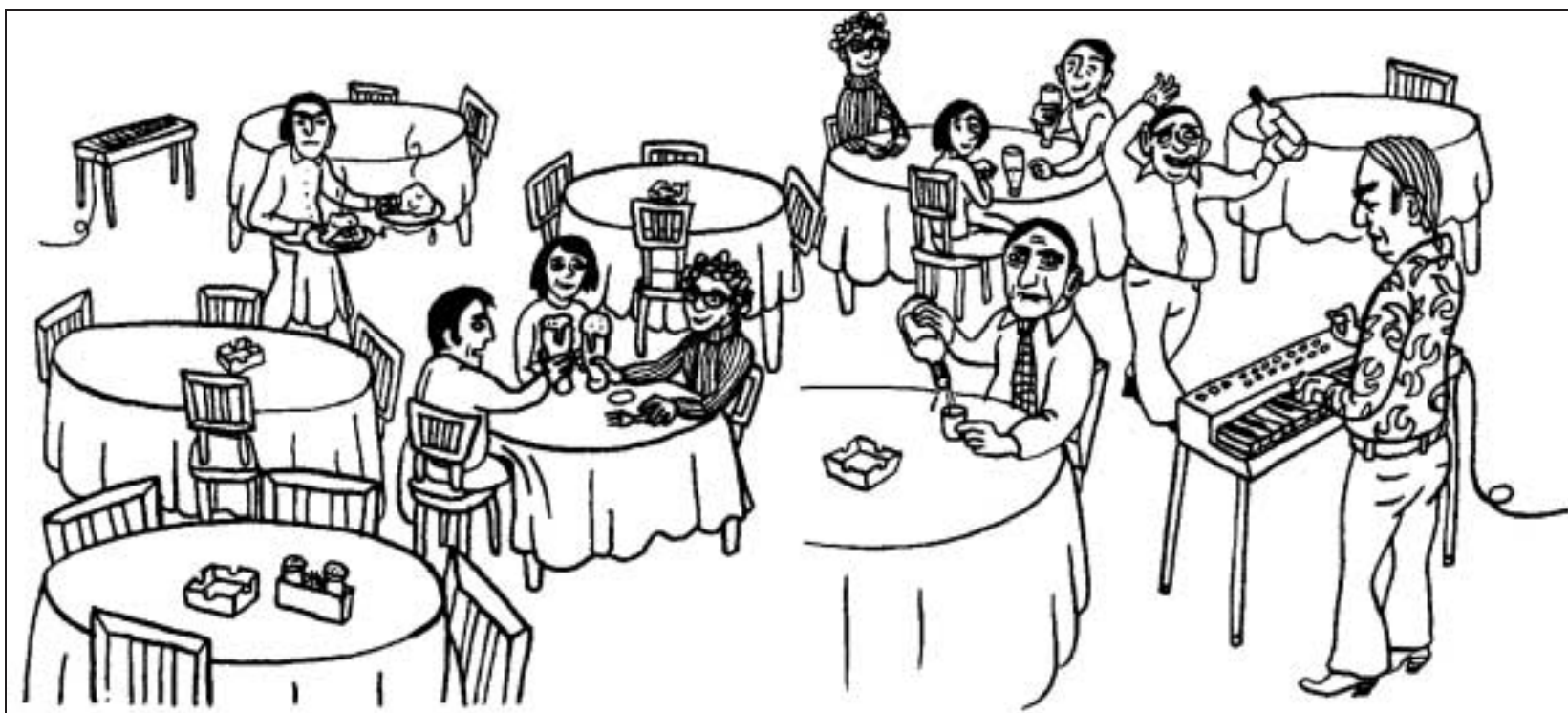
In den grossen Speisesälen der Restaurants waren wir oft die einzigen Gäste.